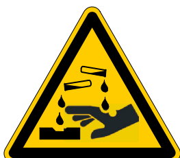
Warnung vor ätzenden Stoffen