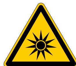
Warnung vor optischer Strahlung