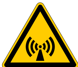
Warnung vor nicht- ionisierender Strahlung