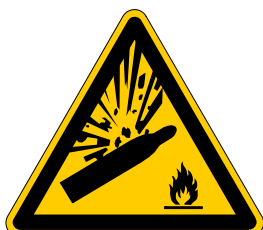
Warnung vor Gasflaschen

Warnzeichen laut Kennzeichnungsverordnung (KennV):