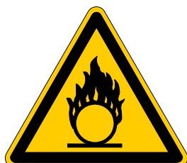
Warnung vor brandfördernden Stoffen