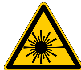
Warnung vor Laserstrahl