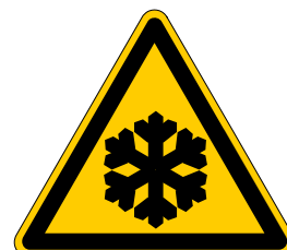
Warnung vor niedriger Temperatur/Frost