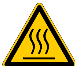
Warnung vor heißer Oberfläche