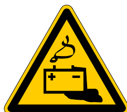
Warnung vor Gefahren durch das Aufladen von Batterien