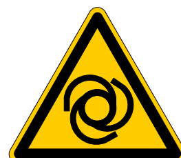
Warnung vor automatischem Anlauf