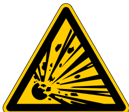
Warnung vor explosionsgefährlichen Stoffen