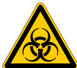
Warnung vor Biogefährdung