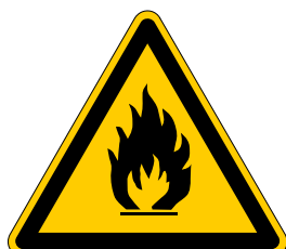
Warnung vor feuer- gefährlichen Stoffen