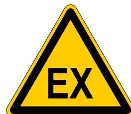
Warnung vor explosionsfähiger Atmosphäre

Warnzeichen laut Kennzeichnungsverordnung (KennV):