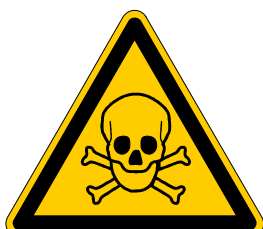
Warnung vor giftigen Stoffen