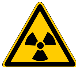
Warnung vor radioaktiven Stoffen oder ionisierender Strahlung