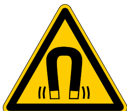
Warnung vor magnetischem Feld